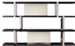
11 DALTON "CHROME" BÜCHERREGAL CM 240X40 H148