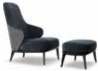
5-6 LESLIE BERGÈRE CM 68X94 H100 HOCKER CM 61X45 H34