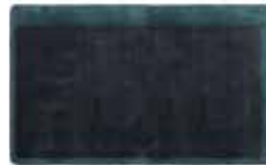
12 DIBBETS CAMBRÉ TEPPICH CM 500X300